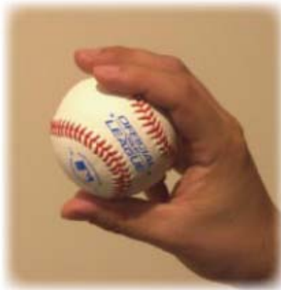
Bonne prise de balle