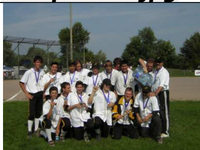
Prov midget 2004.JPG

A partir de 2003, il s'implique activement dans la planification et le déroulement des camps d'entraînements printaniers.